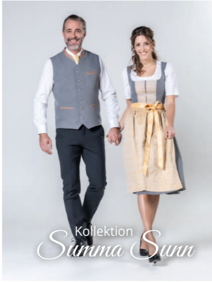
Kollektion Summa Sunn