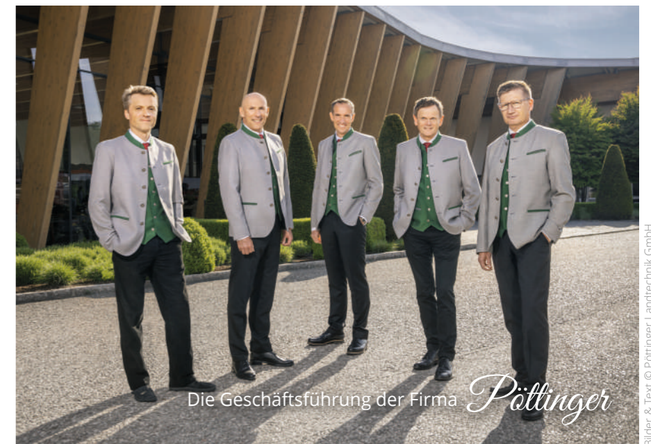
Die Geschäftsführung der Firma Pöttinger