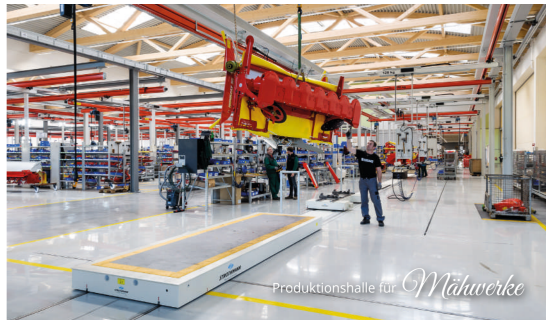
Produktionshalle für Mäherwerke