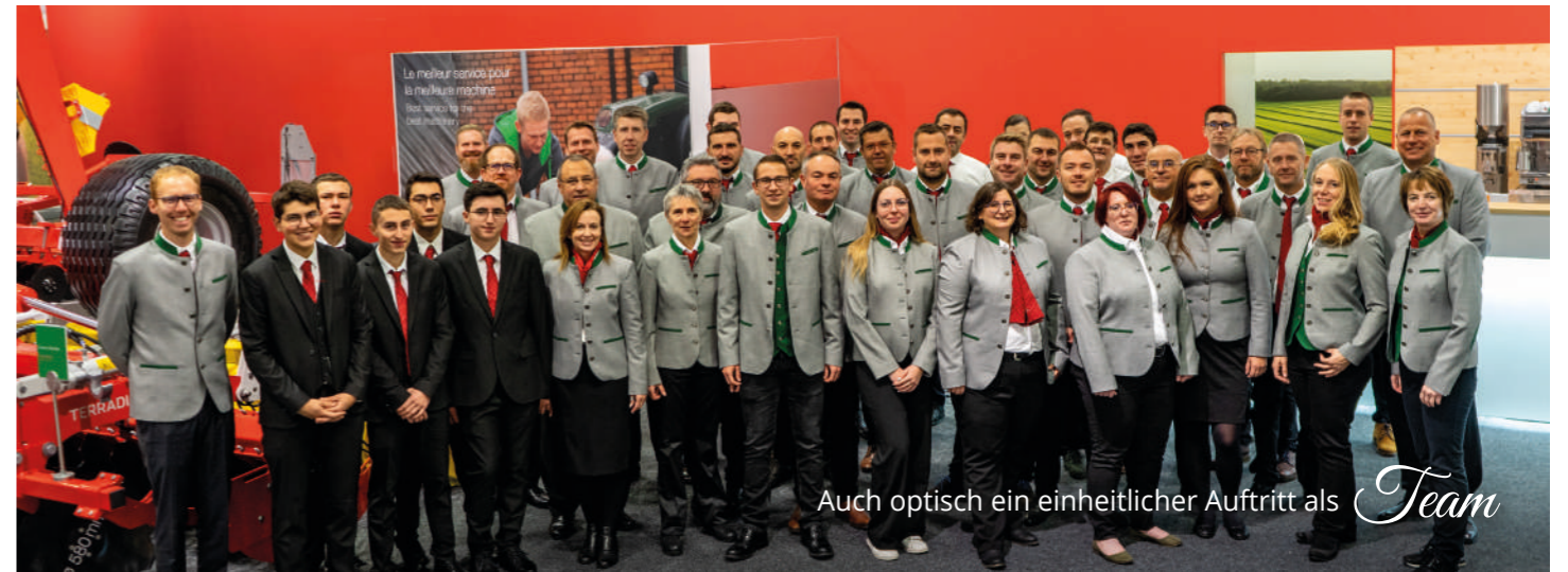
Auch optisch ein einheitlicher Auftritt als Team