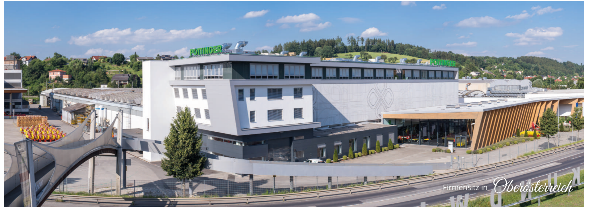
Firmensitz in Oberösterreich

“ Uns verbinden das gemeinsame Werteverständnis und der Anspruch an absolute Premium-Qualität unserer Produkte. ”